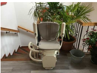
Treppensitzlift zur Wohnung