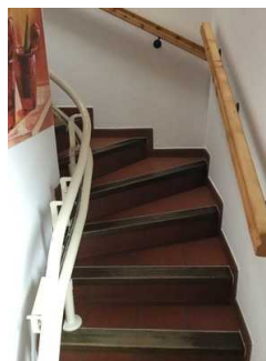
Treppensitzlift zur Wohnung